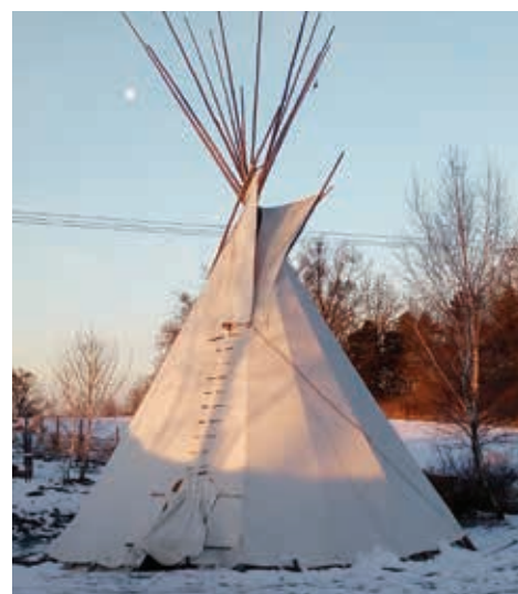
O týpí se musíme v zimě starat a občas v něm zatopit.

19.–23. 7. 2021, cena 3 500 Kč, po celý tábor ubytování a strava na Sluňákově. Info: Libor Sukup, tel.: 585 154 839, email: libor.sukup@slunakov.cz