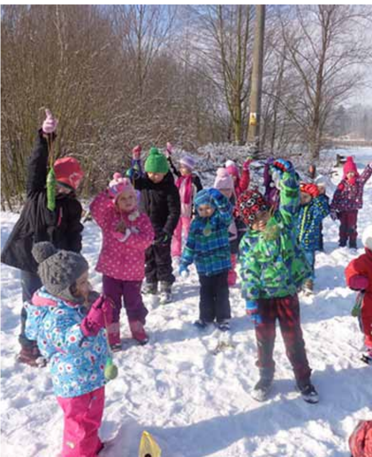
Zelená třída – krmení ptáčků v zimě.