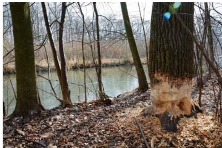
Některé stromy, na kterých řádl bobr, bude třeba pokácet.

V závěru února 2015 byla průběžně prováděna obhlídka vodního toku Střední Moravy – Mlýnského potoka, a to v úseku od jezu v Hynkově po jez v Chomoutově. Obhlídka byla provedena v souladu s §72 zákona 254/2001 Sb. Během této obhlídky bylo zjištěno, že přetrvávají překážky v místech, která již dříve byla označena jako problematická. Zejména zbytky zádky a zhotovený kamenný val