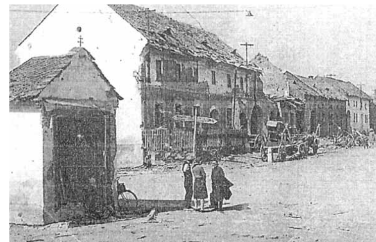
Náměstí Osvobození v roce 1945.

sáhly dvě auta před nádražím.auta se vznášela a shořela i část nádražní střechy.