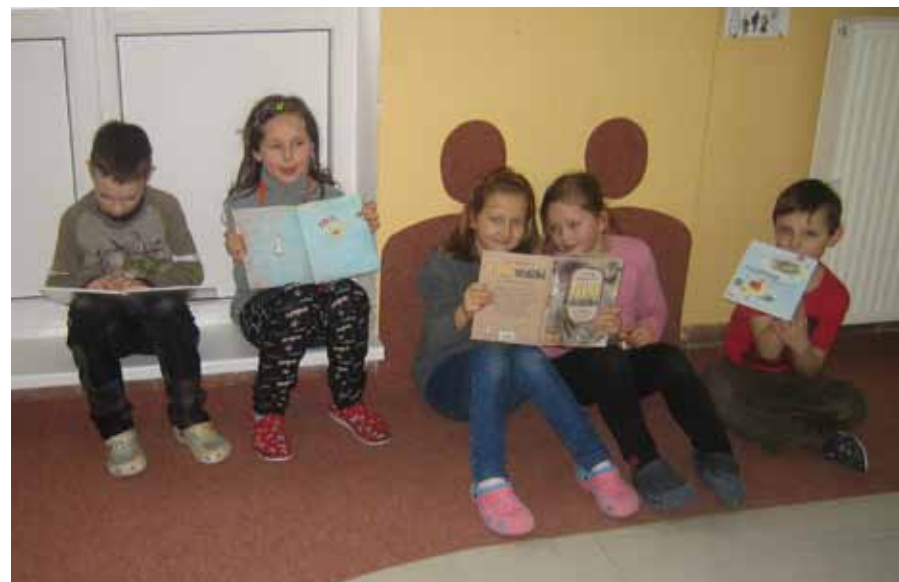
Vztah dětí ke knize se musí vytvořit, v ZŠ Horka se tak děje prostřednictvím čtenářského koutku.

Když má člověk radost, je dobré se o ní podělit a šířit ji kolem sebe. Tak i my učitelé 1. stupně se nesmírně radujeme, protože se nám podařilo