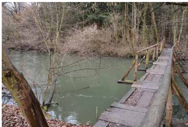
Lávka není v dobrém stavu a musí se opravit.