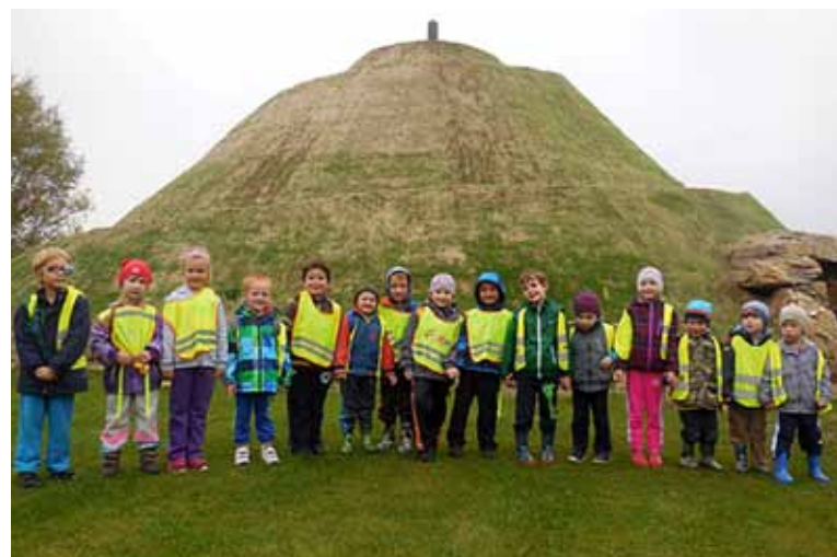
Oranžová třída – návštěva Hory na Sluňákově.

Naši školku navštěvuje 104 dětí ve třídách v barvách duhy, a to nejen z Horok nad Moravou. V oranžové, žluté a zelené třídě se děti vzdělávají klasickým způsobem, v modré třídě se děti vzdělávají podle pedagogiky Montessori.