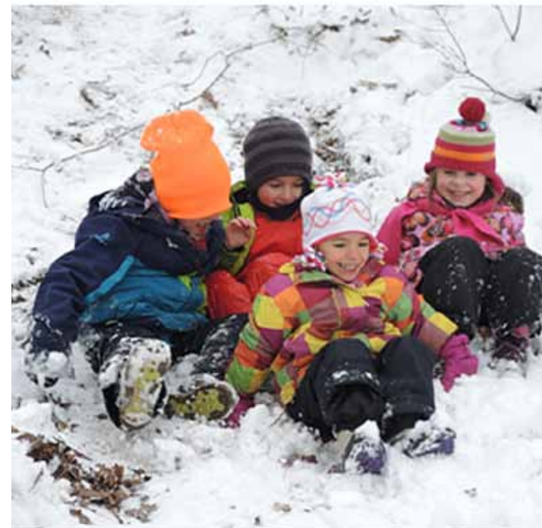
Děti si letošní zimu v Bažince užívaly - sněhu i legrace bylo dost!