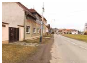
Lidé volají po bezpečných chodnících. Nyní se dočkají obyvatelé ulice 1. Máje.