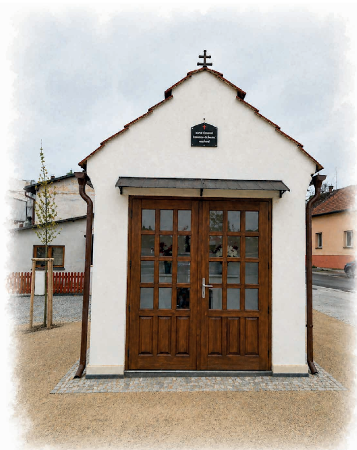
Kaplička v Horce nad Moravou patří Československé církvi husitské. Pochází z 20. let minulého století.