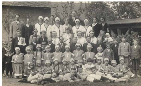
Členové Orla v roce 1932.