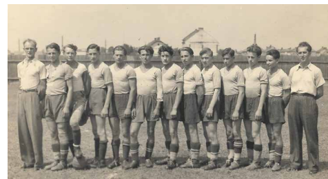
TJ Sokol, oddíl kopané v roce 1942.

Restrikce, zákazy, tlak, strach, nedostatek byly každodenními společníky místních obyvatel. Horka byla osvobozena až v posledních hodinách druhé světové války v Evropě. Ještě 8. května zde probíhal boj mezi jednotkami Rudé armády a ustupujícími německými vojáky. Jako připomínka 2. světové války byl postaven památník osvobození, který byl slavnostně odhalen 12. května 1946. Současně je to také pomník obětí I. a II. světové války z řad horeckých občanů.