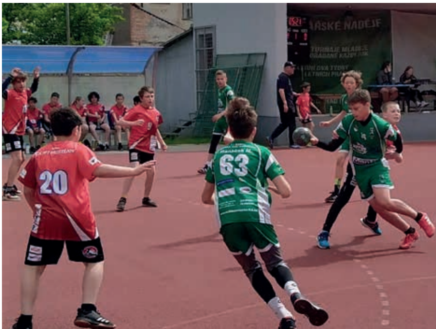
Momentka z květnového házenkářského turnaje mladšího žactva, v kterém tým Horky porazil SK HFP Prostějov 18:2.