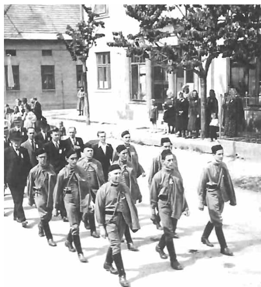
Slavnostní průvod při odhalení pomníku v roce 1946