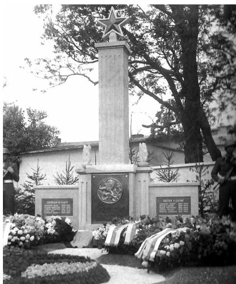
Slavnostní odhalení pomníku obětem I. a II. světové války 12. 5. 1946