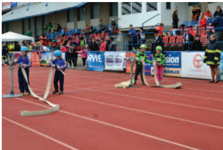
Štafety požárních dvojic v rámci dovednostních disciplín.

v kategorii MLADŠÍ (5–10 let), trénink probíhá každou středu (od 16:30) a pátek (od 16:00).