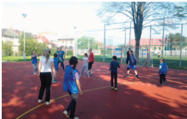
Společný trénink rodičů s dětmi. Rodiče tak měli možnost vyzkoušet si házenou na vlastní kůži a děti se mohly pochlubit tím, co se naučily.

Blíží se období letních prázdnin a s tím je spojená i sportovní „přestávka“. Děti se nám rozutečou k babičkám, na tábory, dovolené, aj. Proto chceme dětem nabídnout i alternativu příměstského tábora, který již tradičně pořádáme poslední týden v srpnu, tedy v termínu 24.–28. 8. 2015. Tábor je určený pro děti narozené v letech 2004–2009, děti se mohou těšit jako vždy na sportovní náplň, celodenní výlet, návštěvu policejní stanice, aj. V případě zájmu dětí rád poskytnu bližší informace prostřednictvím e-mailu: zu-ros@seznam.cz. Od srpna se také „rozjede“ příprava všech družstev na nadcházející sezónu 2015/2016, kdy veškeré aktuality budou dostupné na www. HazenaHorka.cz