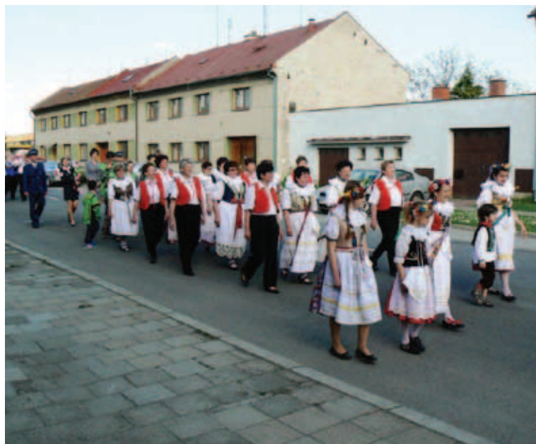
V rámci 70. výročí osvobození se konal v Horce nad Moravou průvod.

A přesto tady v Evropě, na starém kontinentě, vznikaly nejrůznější ideologie, byla zde spousta příkoří a emocií. Zárukou míru je tu dnes Evropská unie, jejímž cílem je poskytovat lidem prostor svobody, bezpečnosti a práva. Prostřednictvím Schengenu můžeme svobodně cestovat, seznamovat se s nejrůznějšími kulturami,