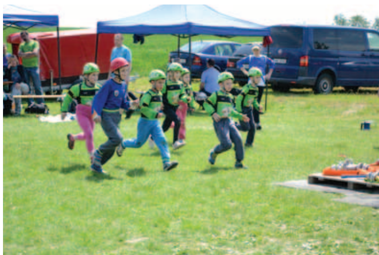
Soutěž v požárním útoku V Doloplazích.