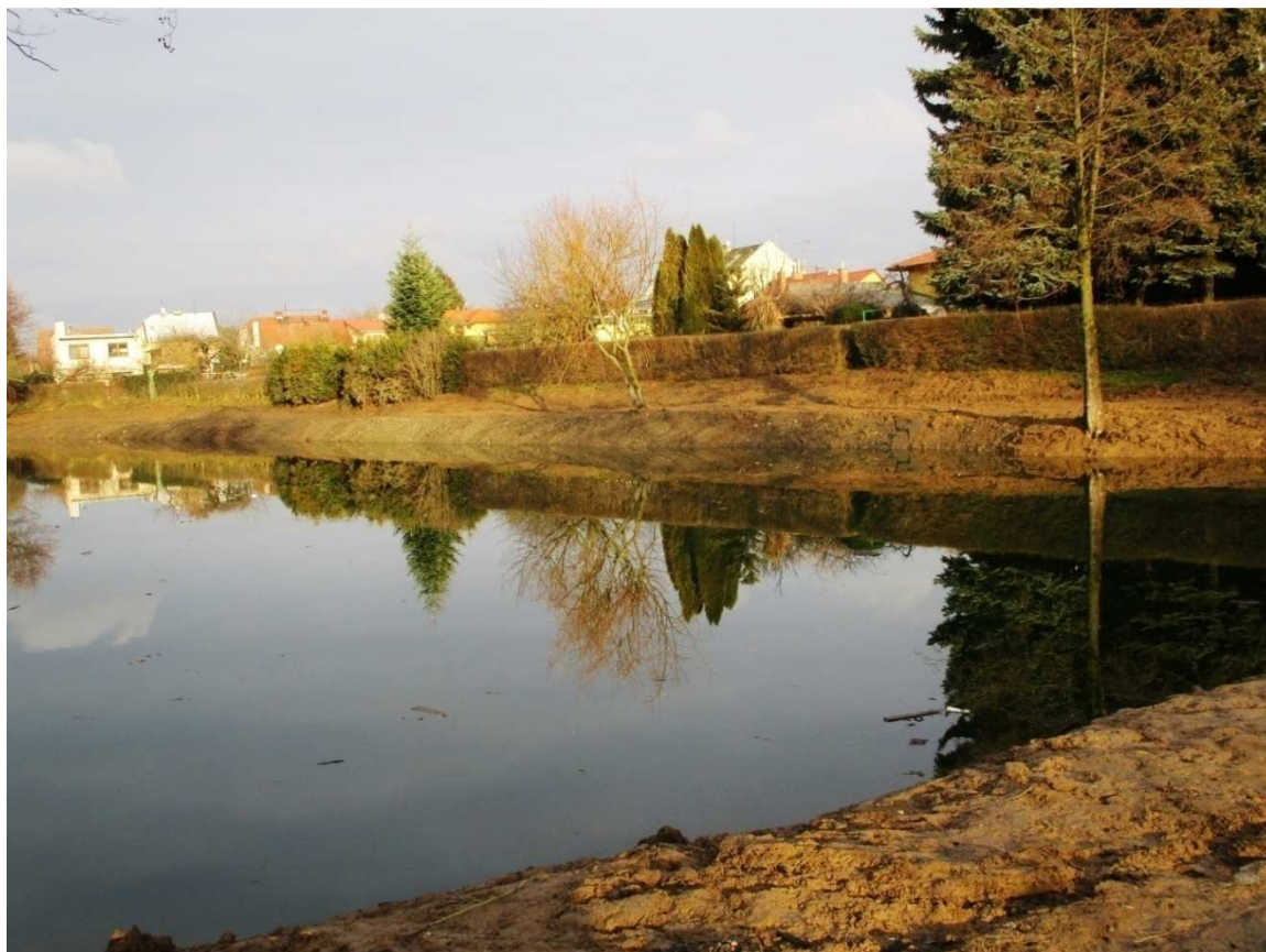
Foto 57 Úpravy hřbitova