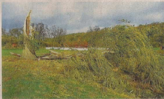
↗ Vrba u Běleckého Mlýna ve Zdětině přežila obě světové války, ale včerejší počasí ji porazilo.