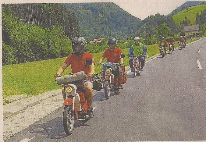
VÝPRAVA. Sběratelé a jezdci na legendárních Jawách 50 Pionýr z Horky se letos vypravili až do Slovinska.

Doprovodné auto je vždy plné náhradních dílů. Před cestou se nesmí podcenit příprava. „Žádné větší komplikace našťastí nebyly, jediné větší zdržení bylo při výměně karburátoru,“ dodává Poprava s tím, že mnohem náročnější je udržet morálku na cestě.