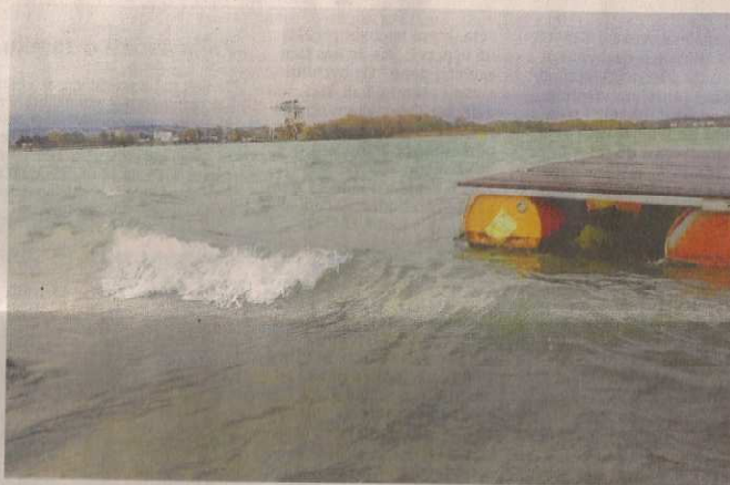
↑ Hanácké moře. Silný vítr vytvořil včera na pískovně v Nákle na Olomoucku vlny.

Celou republiku i Olomoucký kraj zasáhl včera silný vítr. Hasiči řešili uvolněné střechy, padající stromy ničily elektrická vedení a komplikovaly dopravu. Hasiči vyjeli k téměř pěti stovkám událostí, operační středisko přijímalo každou minutu desítky žádosti o pomoc profesionálních a dobrovolných jednotek. Podívejte se na fotografie hasičů, redaktorů Deníku i čtenářů