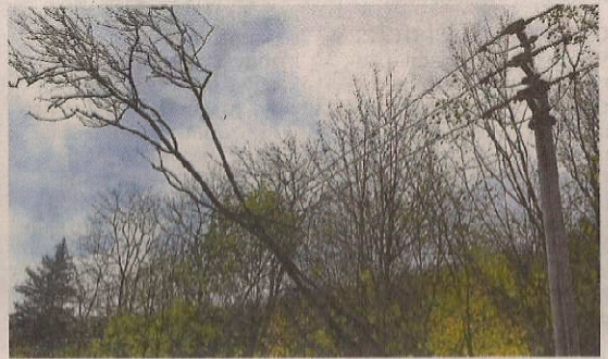
↑ V Javorníku vypadávala elektřin v noci na neděli, v částech Travná a Zálesí nešla ani v neděli v poledne.

➔ Plechý na střeše domu ohrožovaly chodce v Palackého ulici v Přerově. Střechy byly problémem na více místech, hasiči s nimi pomáhali také v přerovské ulici U Žebračky. V přerovské Letecké ulici vyvrátil vítr celou zastávku. V Žeravicích spadl strom na chatu.