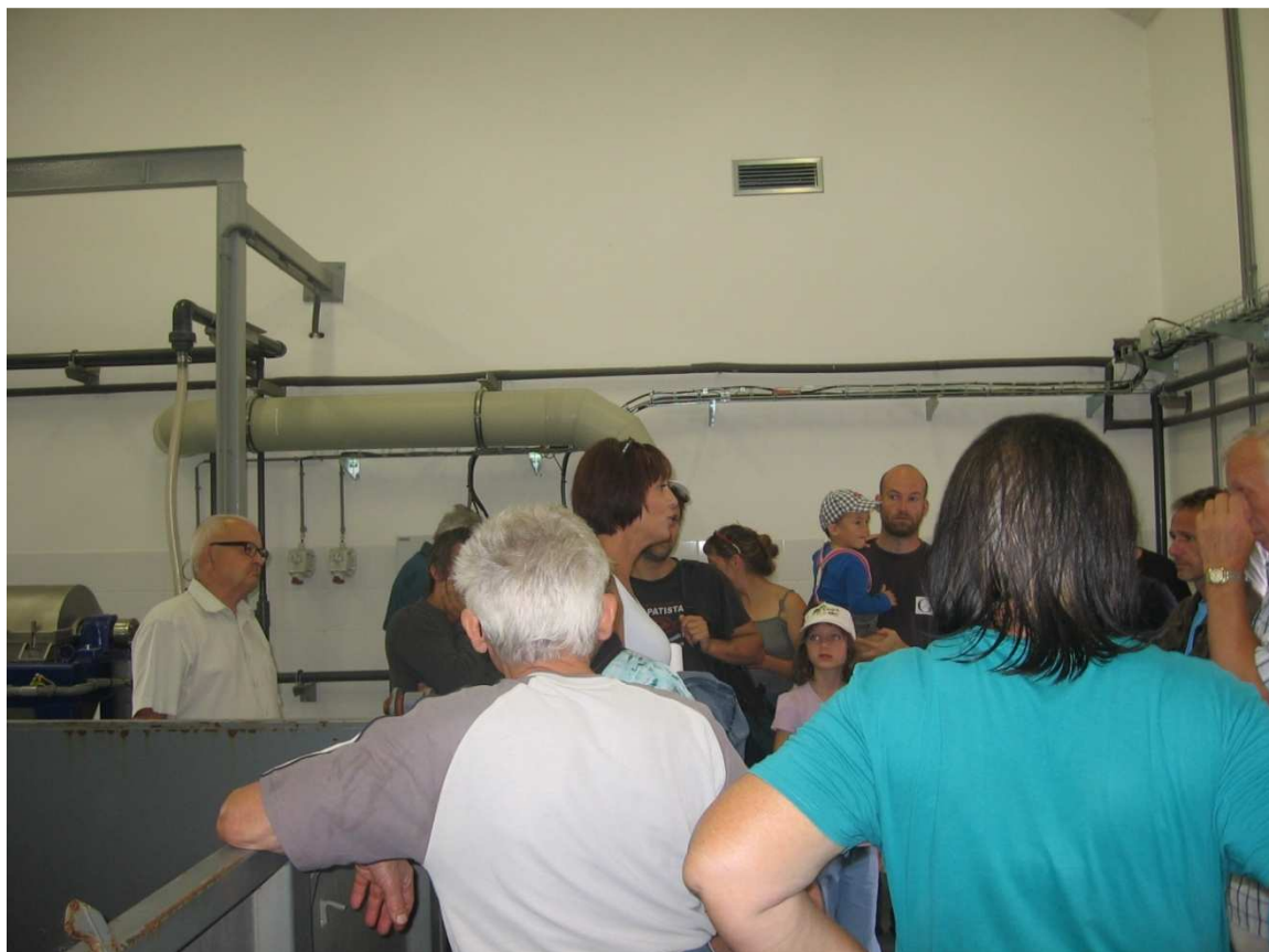
Foto 14 Prohlídka vodní elektrárny ve mlýně