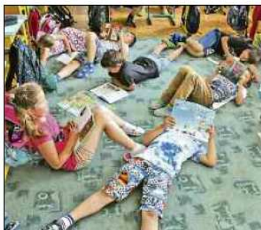
Vsedě, vleže, ve třídě, na chodbě. V jakékoliv poloze a takřka kdekoliv mohou být děti z Horky nad Moravou při hodinách čtení. Hlavní přítom je, aby je čtení bavilo.