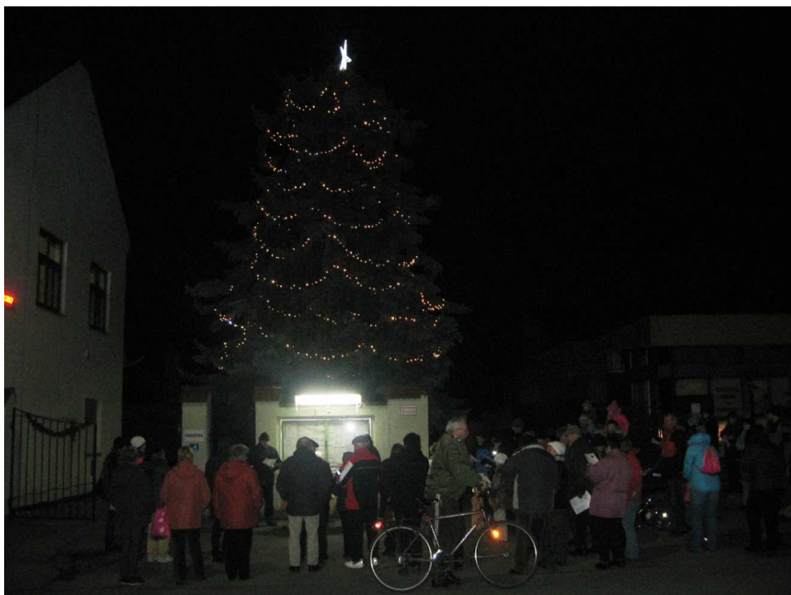
Foto 27 Benefiční koncert skupiny Alibaba