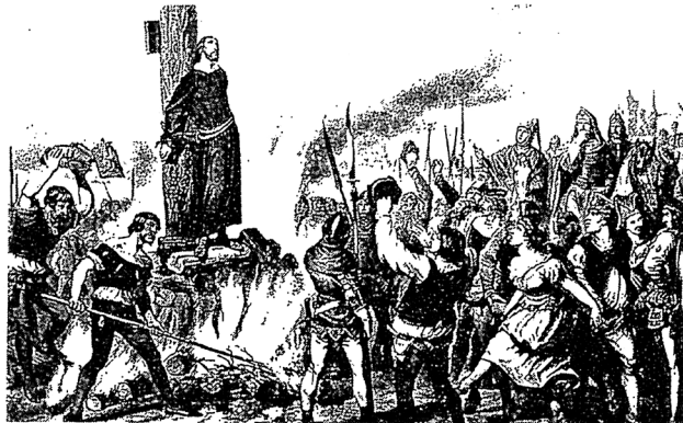
Zobrazení Husova upálení (švýcarská pohlednice z r. 1895)

Horka nad Moravou středa 5. července 2017