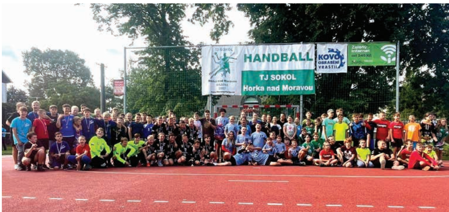
Devět družstev, startujících na horeckém turnaji mladšího žactva, v jeho závěru zapózovalo fotografům.