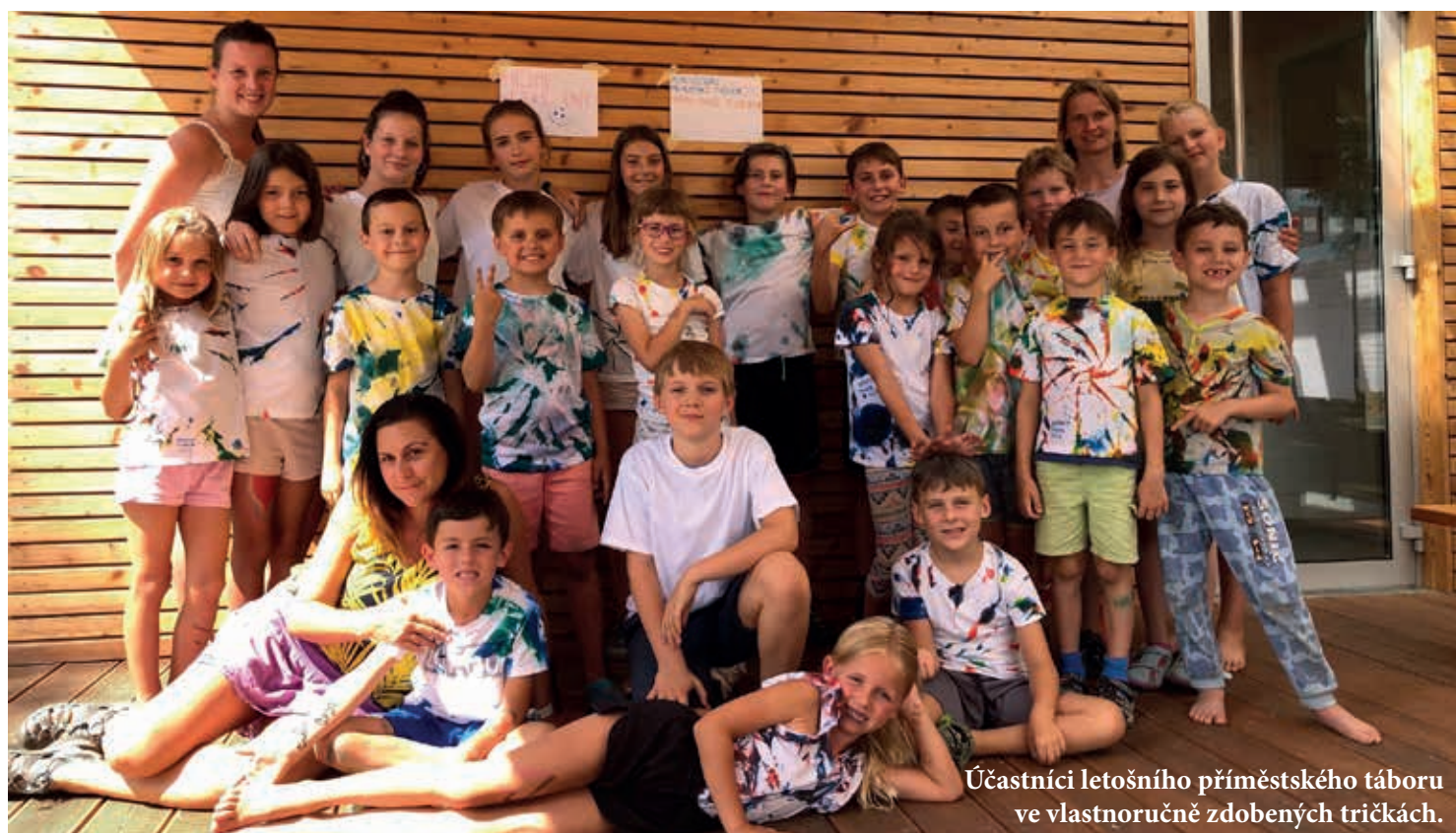
Účastníci letošního příměstského tábora ve vlastnoručně zdobených tričkách.