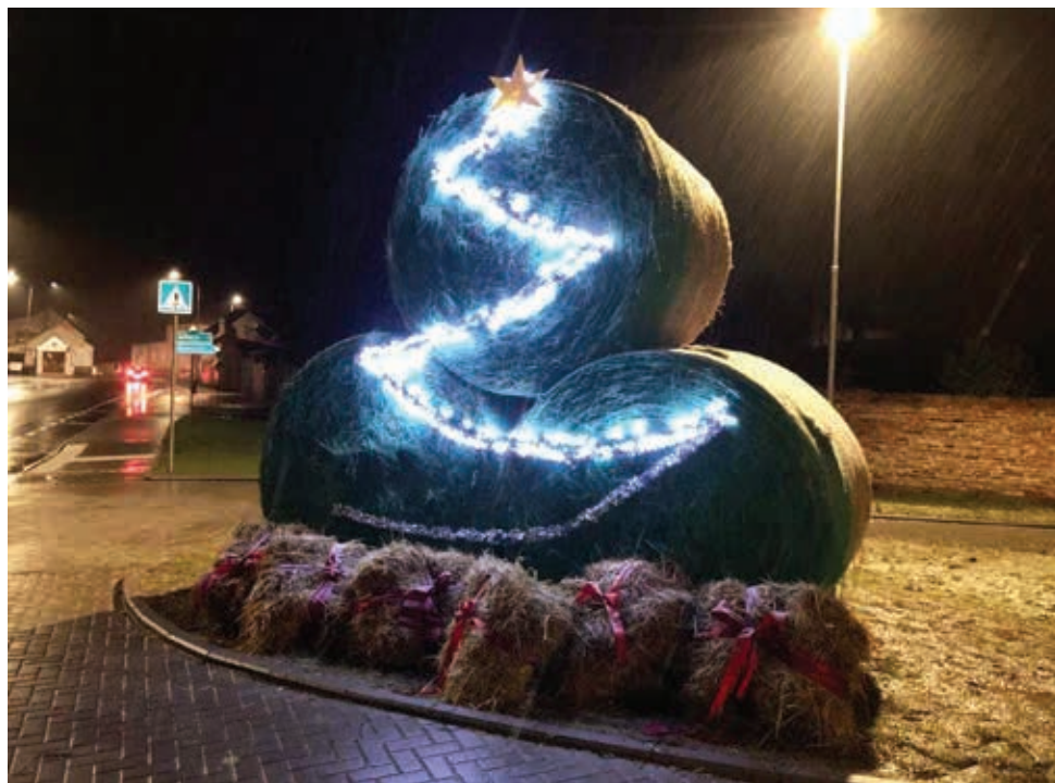
Na Olomoucké ulici vánoční stromček z balíků slámy.